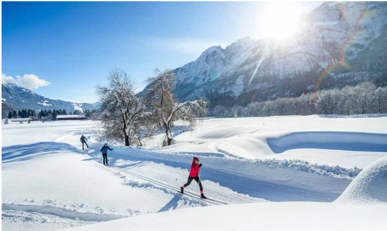
Die idyllischen Loipen entlang des Lienz Talbodens, vor der Kulisse der Lienz Dolomiten